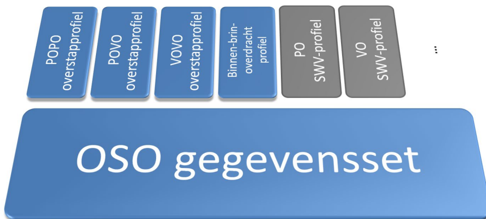
Figuur 1: OSO Gegevensset met Overstapprofielen (blauw-gekleurd).

De gegevensset bestaat uit gegevensblokken en gegevensvelden (de gegevenselementen). Een gegevensblok is een element die blokken en/of velden bevat; een gegevensveld is een gegevenselement die een waarde bevat. In een profiel kunnen de volgende verplichtingen, inperkingen en voorwaarden op deze gegevenselementen voorkomen: