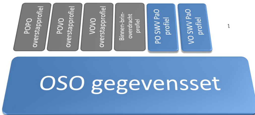
Figuur 1: OSO Gegevensset met SWV-profielen (blauw-gekleurd).

De gegevensset bestaat uit gegevensblokken en gegevensvelden (de gegevenselementen). Een gegevensblok is een element die blokken en/of velden bevat; een gegevensveld is een gegevenselement die een waarde bevat. In een profiel kunnen de volgende verplichtingen, inperkingen en voorwaarden op deze gegevenselementen voorkomen: